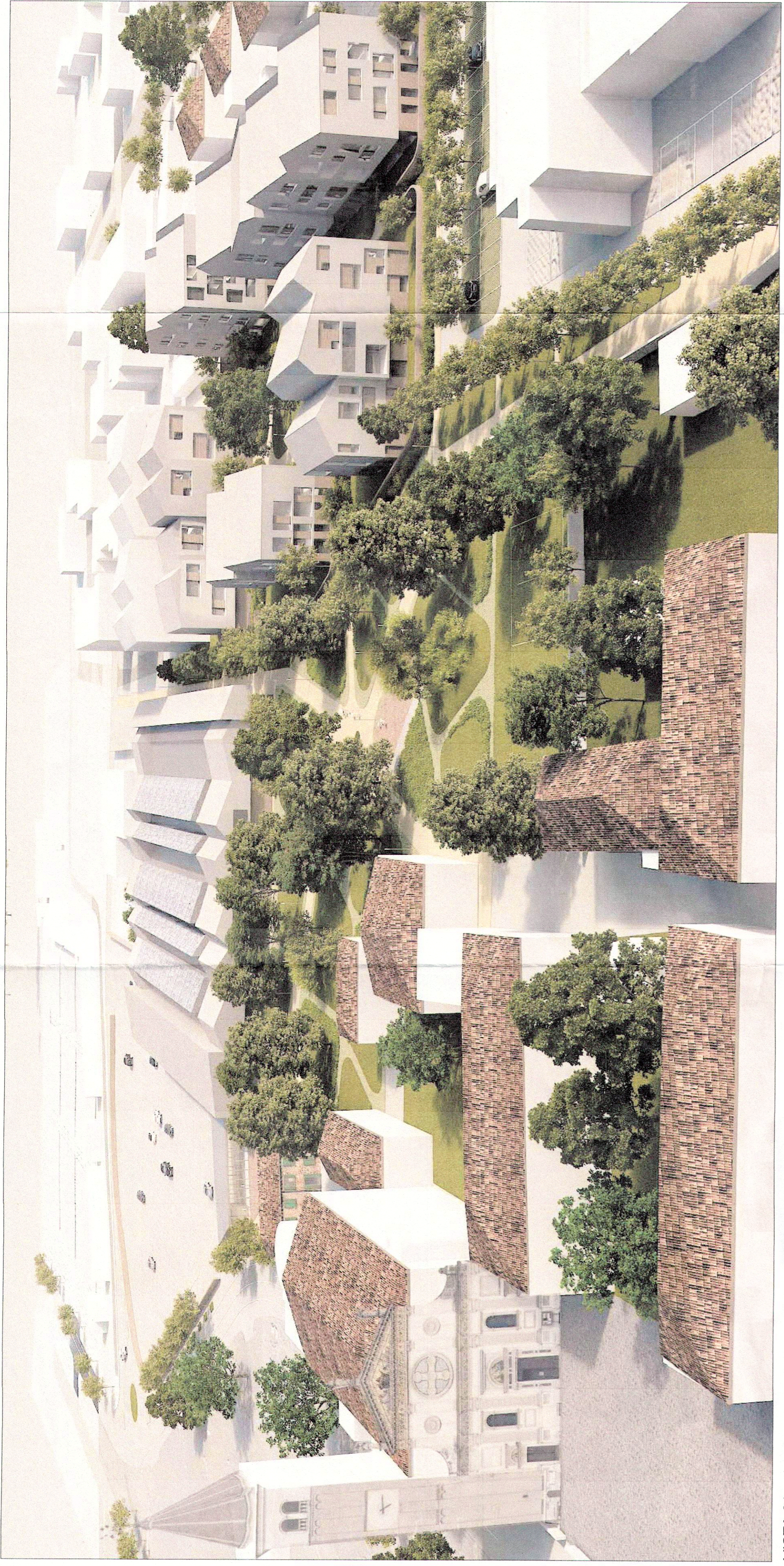
VISTA 01 - vista aerea con fabbricati indicativi