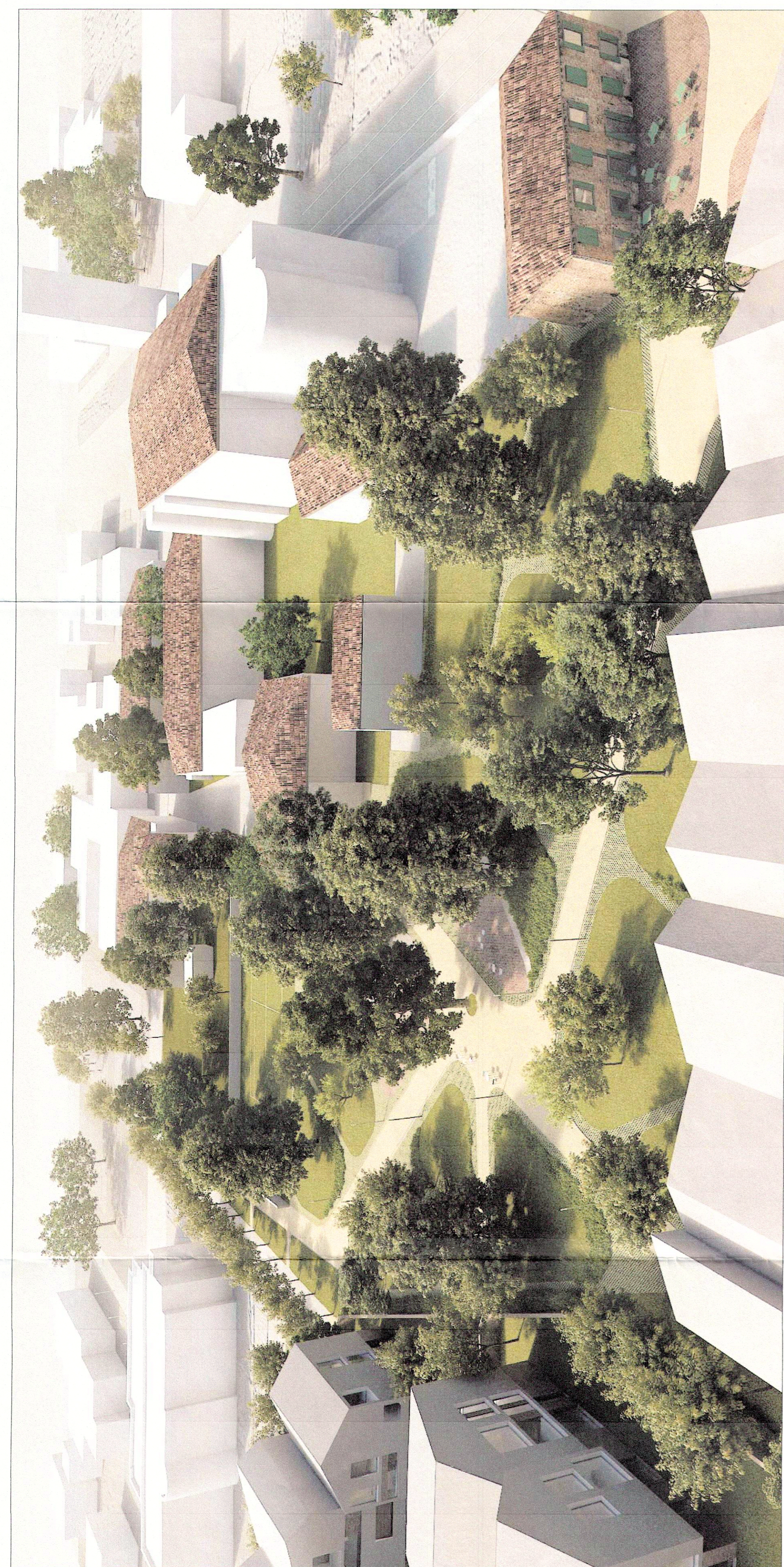
VISTA 02 - vista aerea con fabbricati indicativi