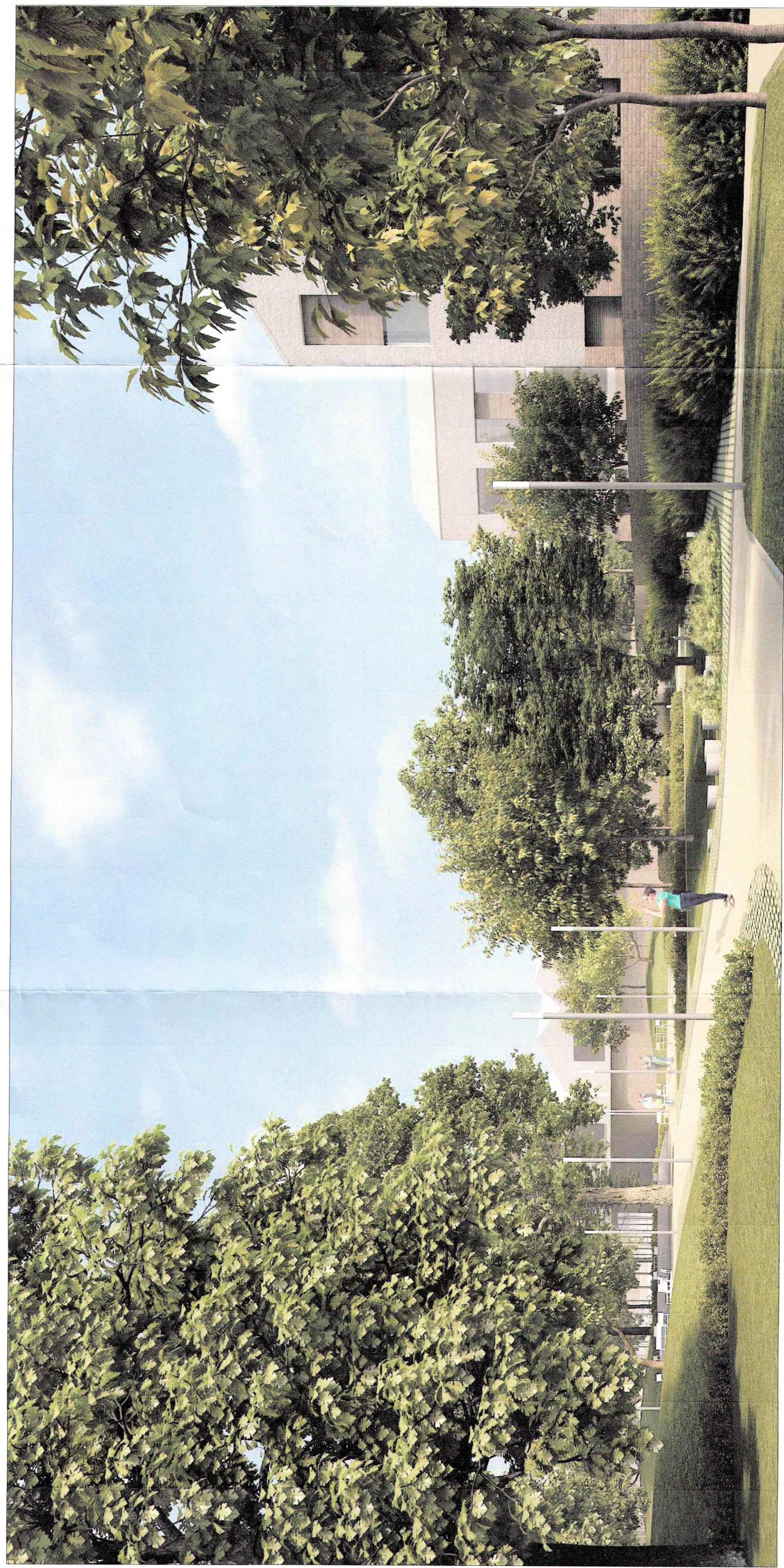
VISTA 03 - vista dell'ingresso al parco con fabbricati indicativi