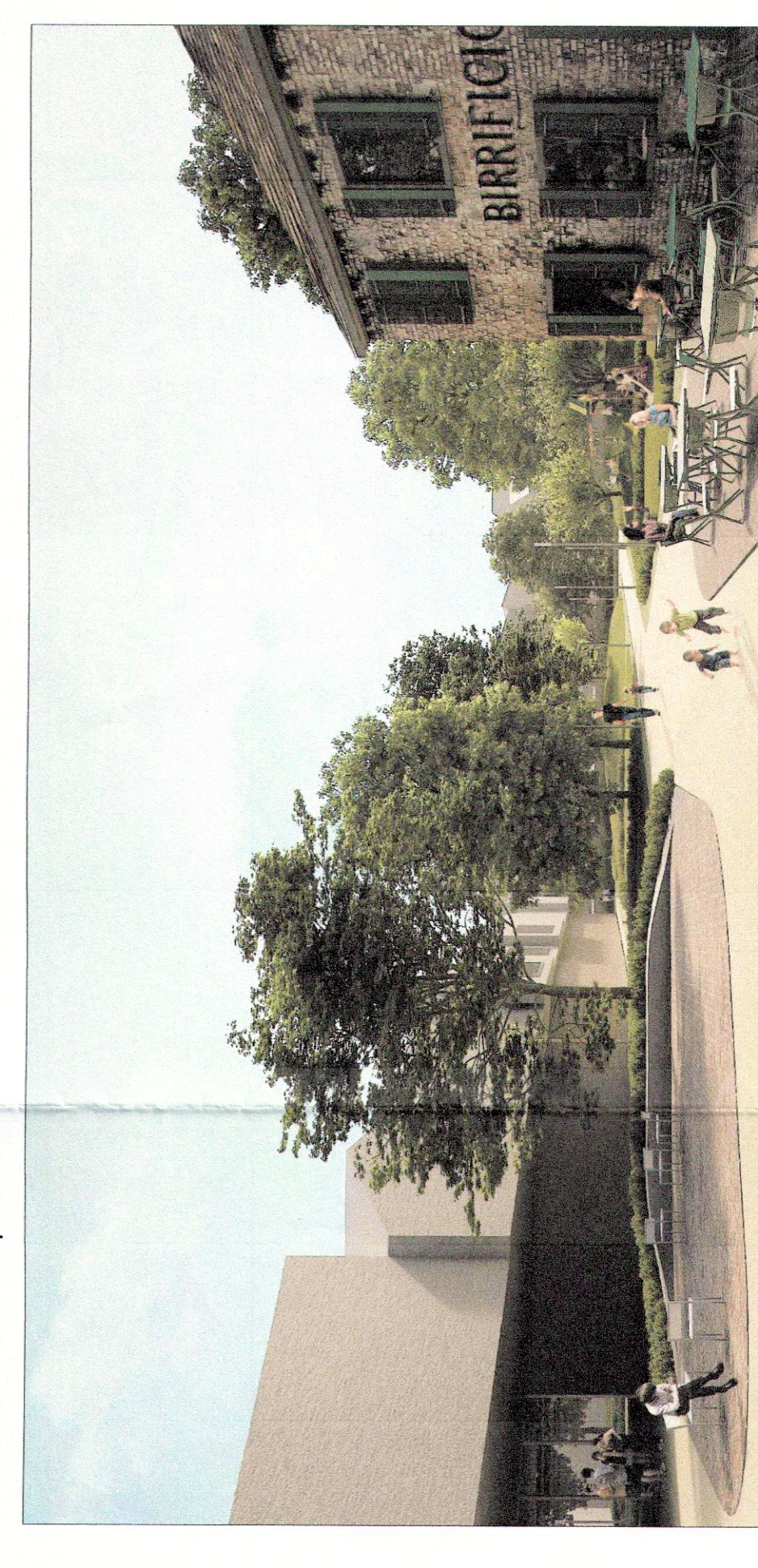
VISTA 05 - vista della piazzetta